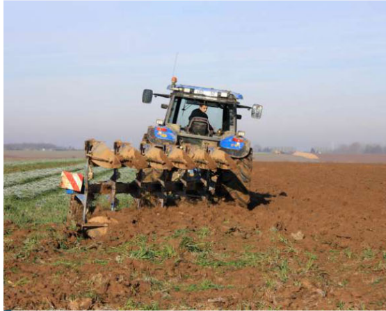
Objectif affiché de cette commission : promouvoir la santé et la sécurité au travail et participer à l'amélioration des conditions de travail dans les petites entreprises agricoles.

Objectif affiché de cette commission : promouvoir la santé et la sécurité au travail et participer à l'amélioration des conditions de travail dans les petites entreprises agricoles. Le collège est composé à parts égales de représentants des salariés et de représentants des employeurs, en fonction des résultats aux élections de la chambre d'agriculture. Actuellement, deux sièges sont occupés par la FDSEA (un par département), un par les EDT et deux par l'UNEP (espaces verts) ; côté syndicats, les sièges sont