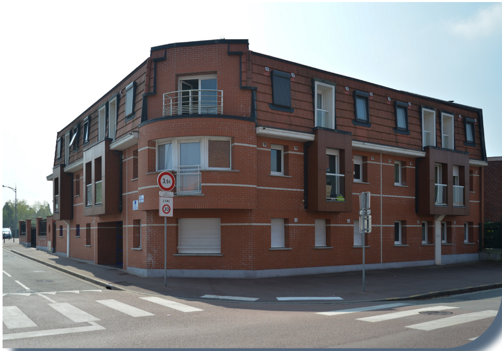
Pension de famille à Comines