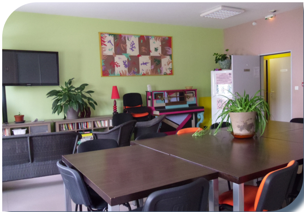
Pension de famille à St Quentin