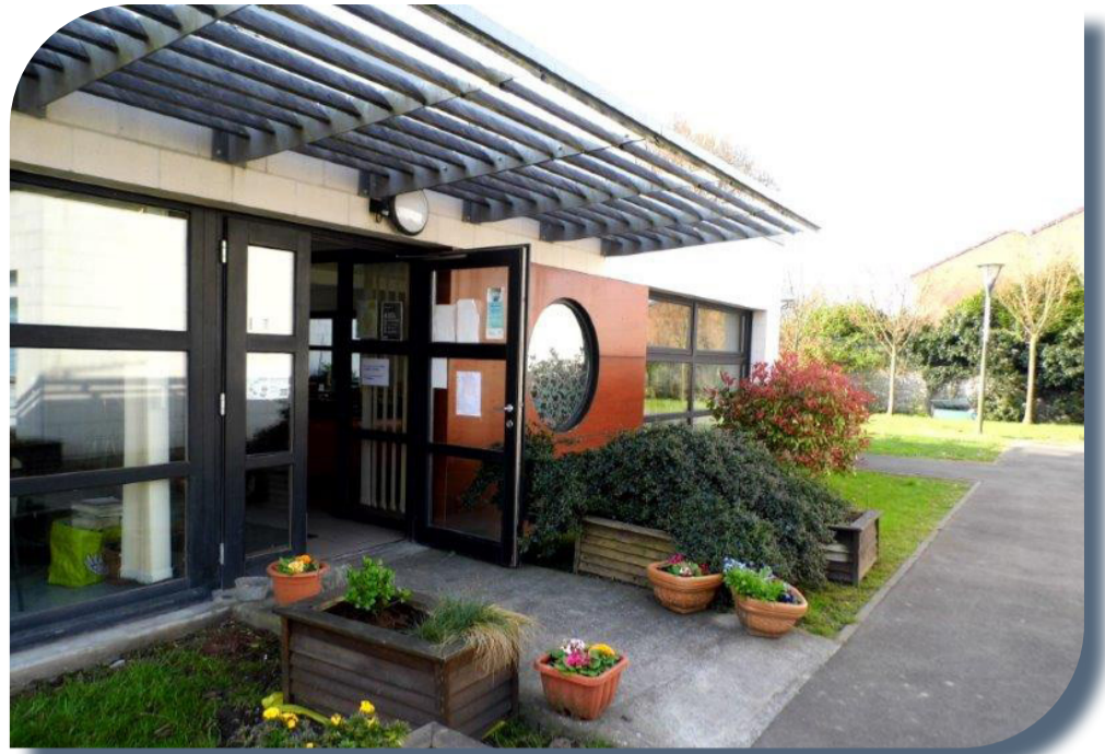
Pension de famille à Lambersart