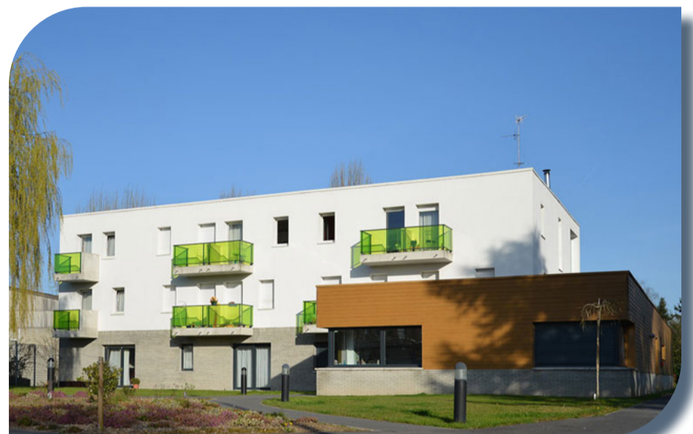
Pension de famille Augustin Laurent à Ronchin

Ce document vous présente ce qu'est une pension de famille et l'intérêt de ce type de projet pour votre territoire. Il a été réalisé par la Direction régionale de l'économie, l'emploi, du travail et des solidarités (DREETS) Hauts-de-France, par la Fédération des acteurs de solidarités (FAS), par la Fondation Abbé Pierre (FAP), par l'Union professionnelle du logement accompagné (UNAFO) et par l'Union régionale pour l'habitat (URH).