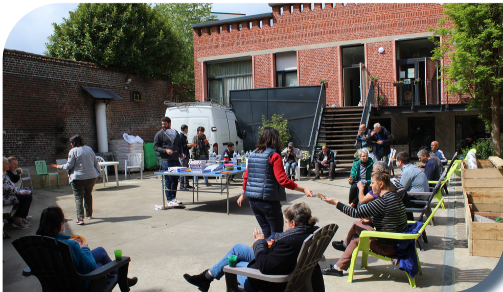
Pension de famille Gabriel Lecorne à Tourcoing

Des structures mixtes pension de famille/résidence accueil sont également possibles.