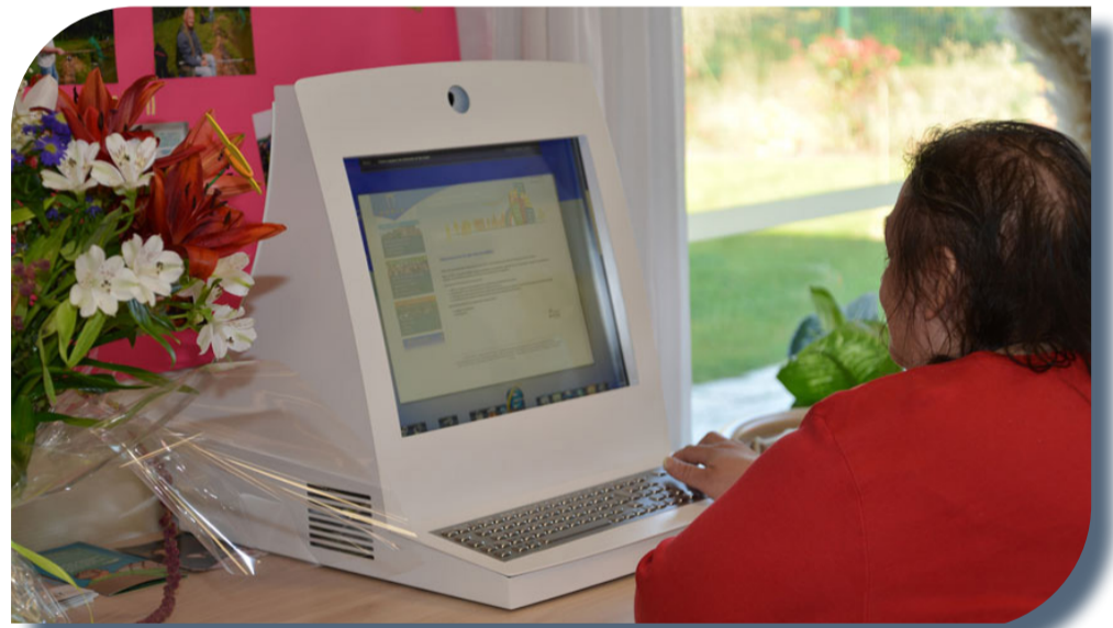
Pension de famille Augustin Laurent à Ronchin

Les collectivités locales délivrent notamment les permis de construire et participent généralement en garantissant les emprunts. Elles peuvent également mettre du foncier à disposition et soutenir financièrement le projet