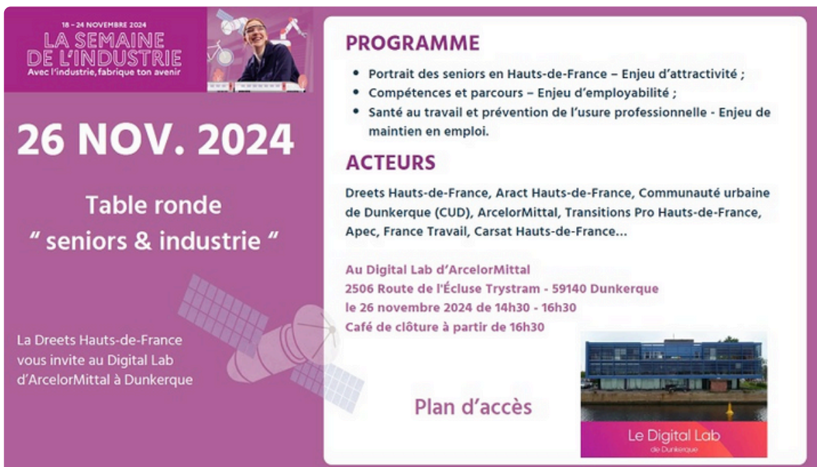
Table ronde animée par AEF Info